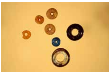
Perlerne fra grav A's udstyr. T.v. ravhalskæden, foroven glasperlerne. Den såkaldte overfangsperle, som er provinsialromersk, er placeret nederst i billedet.

perler var der 40 berlokformede, dvs. en slags asymmetriske, buttede dobbeltperler med hvepsetalje, hvis mindste del er gennemboret. Desuden indgik der enkelte specielle perler, blandt andet en såkaldt overfangsperle, hvis klare kerne ved fremstillingen er blevet overtrukket med et lag af purpurfarvet glas. Endelig må nævnes nogle glasvedhæng, som står uden kendte danske paralleller.