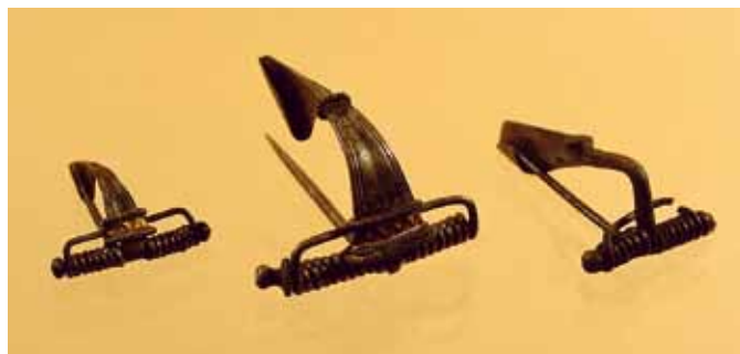
De tre fine sølvdragtspænder, som var medgivet den døde kvinde i grav C.

en mæanderlignende måde og er samlet i en flad, dåseformet låseanordning. Den er et lille mesterværk i sig selv, opbygget af fire dele. Placeringen i graven viser, at det bølgede stykke vendte fremad, og at låsedåsen var bag på halsen.