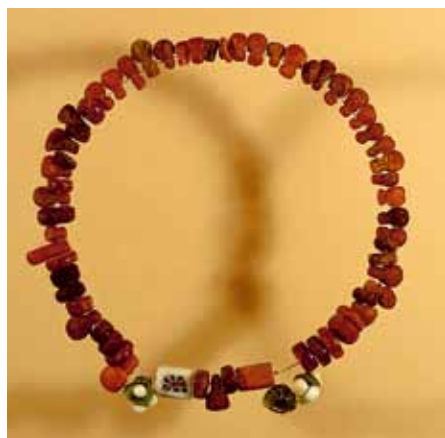
Til venstre ses perlekæden fra grav B. Et af de to specielle glasvedhæng er vist i dobbelt størrelse på billedet til højre. Antagelig er det fremstillet på