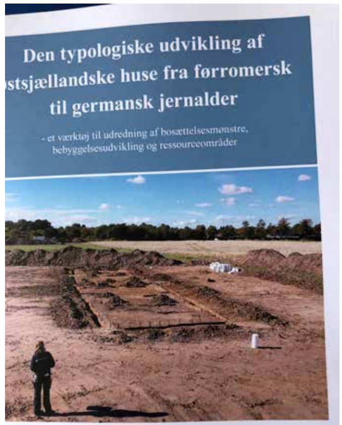
Kroppedal Museums nye ph.d. om jernalderhuse i Østsjælland.

Sparrevohn, L. R., O. T. Kastholm & P. O. Nielsen 2019 (eds). Houses for the Living. Two-aisled houses from the Neolithic and Early Bronze Age in Denmark. Volume 1 - Text. Volume 2 - Catalogue . The Royal Society of Northern Antiquaries - Copenhagen 2019. University Press of Southern Denmark.