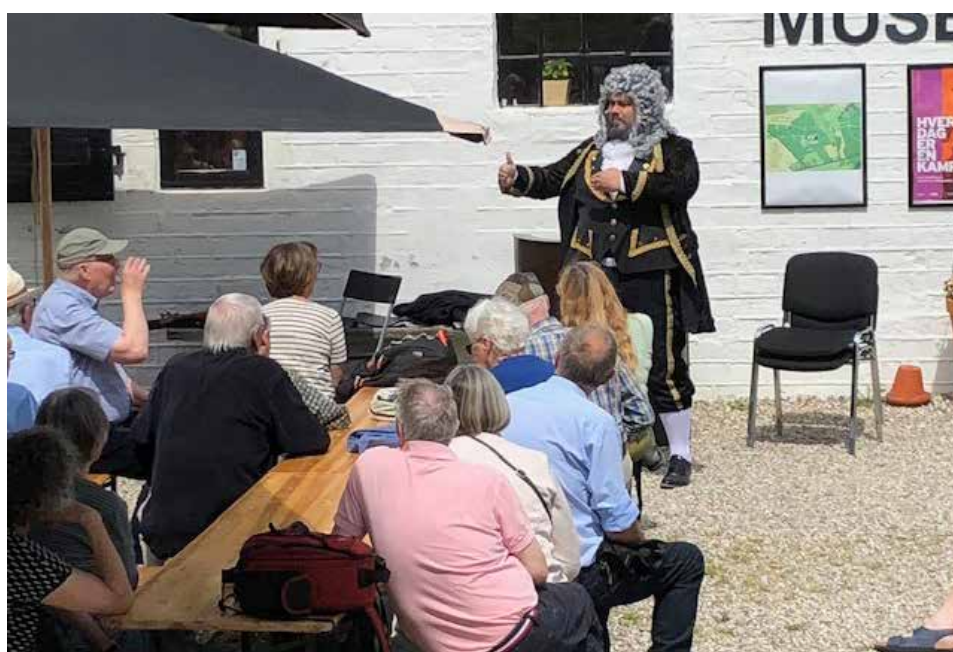
Ole Rømers assistent fortæller om mesterens arbejde.

Den 1. søndag i juni måned afholder Danmarkshistorien i Vestskoven altid sit årsarrangement indenfor Vestskovens område. I 2019 fejrede vi astronomen Ole Rømers 375 års fødselsdag. Arrangementet havde sit udgangspunkt på Kroppedal Museum, hvor der var taler, vandretur til Rømers observatorium, Renæssance-musik ved kvintetten Götterfunken og servering af lækkerier fra Renæssancens køkken, serveret af Vikingelandsbyens Venner. Over 100 besøgende havde en dejlig dag.