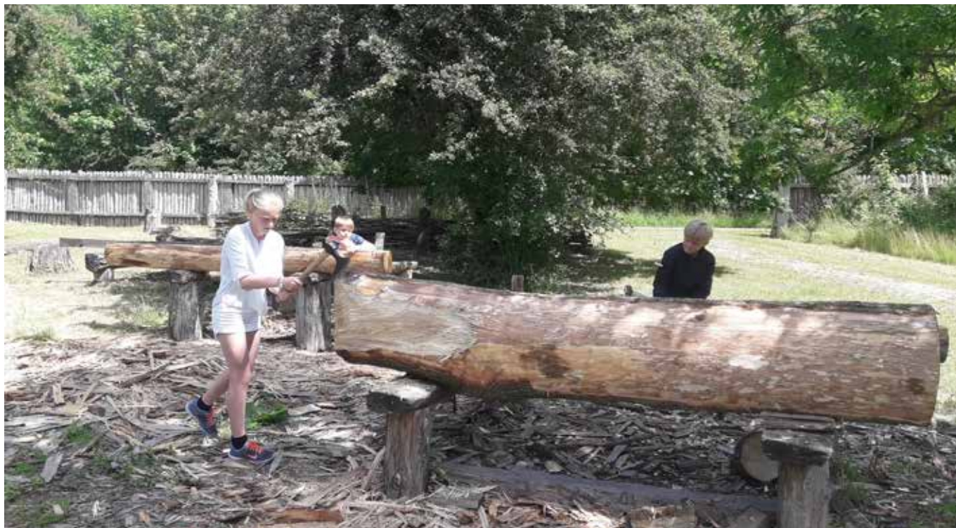
Børnearbejde i vikingebro-projektet.