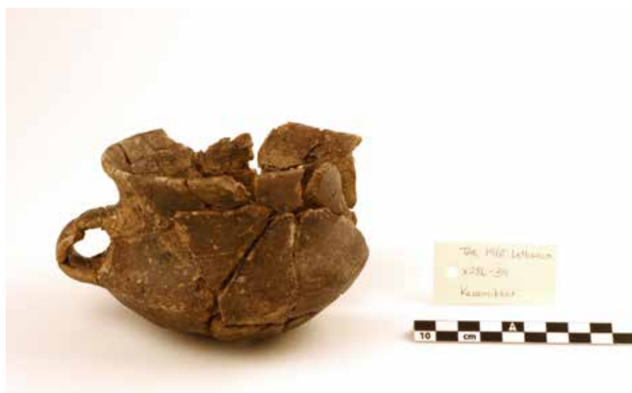
Lerkop med hank fundet i barnegrav fra yngre romersk jernalder fra Hanevad.