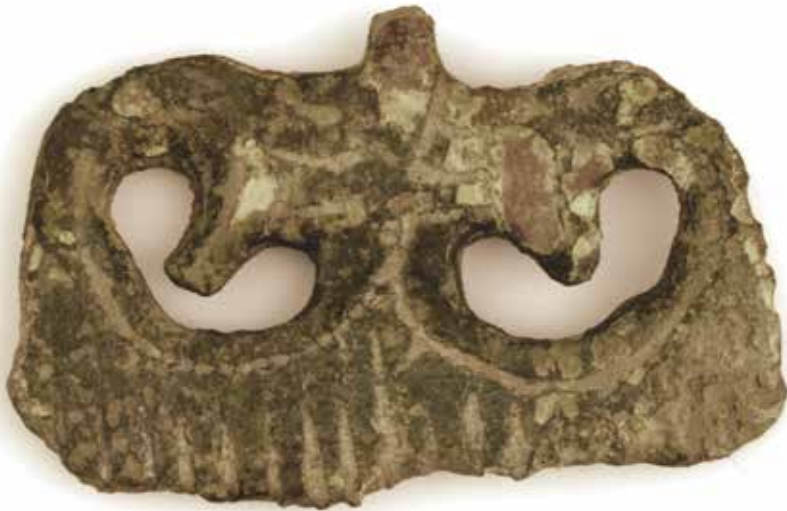
Kamamulletten fra Vridsløsemagle.