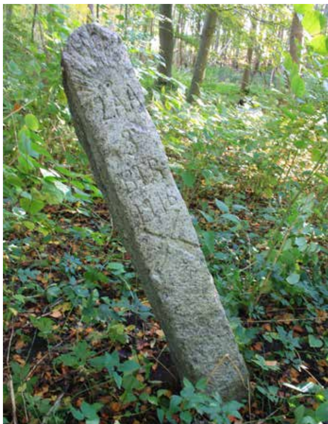
Mandshøj militær markeringssten for 3. Batteri / 2. Artilleriafdeling der i 1916 under 1. verdenskrig har haft kantonnement og/eller opstilling ved Edelgave. Øverst ses indhugget et symbol på en eksploderende artillerigranat. Derunder ses: "2.A.A. og "3 BTR" samt 1916. Nederst endvidere et par korslagte kanoner.

Styrelsen har det overordnede ansvar for Danmarks fredede fortidsminder, og er besluttende myndighed hvad angår mulige nye fredninger samt står for den endelige tinglysning. Årligt modtager museet tillige fredningsmæssige særopgaver til udførelse for Slots- og Kulturstyrelsen, ofte tematiske. Museets arbejde har i år 2019 ført til fredning af fire stenkister under Hørsholm Kongevej i Rude Skov og yderligere én nord for Hørsholm. En stenkiste er en stenbygget konstruktion, som leder et mindre vandløb under en vej. Her er der tale om stenkister, som indgår i den franske vejingeniør Jean