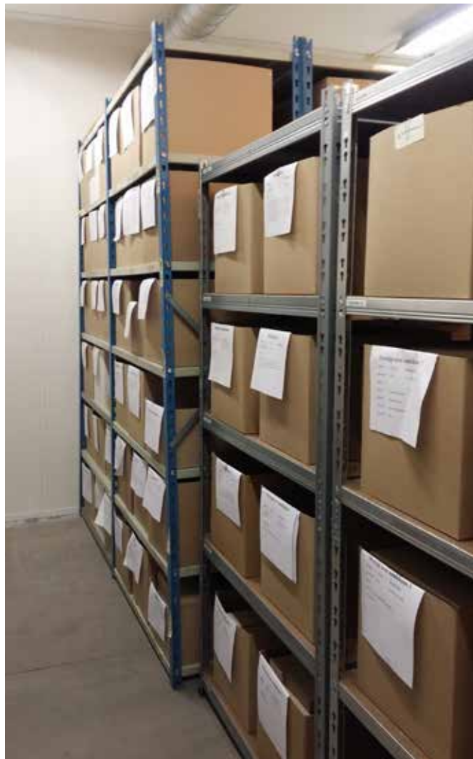
Magasinet i Skovlunde, Ballerup Kommune.

Slots- og Kulturstyrelsen besluttede i 2011 at opdatere det gamle registreringssystem Regin til et helt nyudviklet registreringssystem kaldet SARA (SamlingsRegistrering og Administration). Tidligere blev der anvendt forskellige registreringssystemer rundt om i landet, men nu skal alle museernes registreringer samles i SARA. Det er lovpligtigt for museerne at registrere sagsoplysninger og genstande i SARA. Alle data fra Regin er overført til SARA.