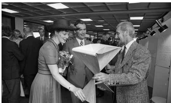
Regentparret i aktion Indvielse af Teknologisk Institut 31. maj 1972. Dronning Margrethe er protektor for instituttet.

I 1993 fik vi licens til det fælles registreringsprogram for lo-