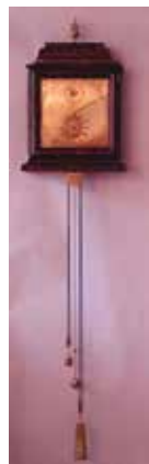
T.v.: Ole Rømers pendulur bliver en del af den nye astronomi-udstilling.

Vi vil gerne gøre Danmark og verden opmærksomme på denne strålende kvinde og ønsker at undersøge hvordan det lykkedes hende at blive en så agtet stjerne i en ekstremt mandedomineret verden. Artiklen forventes at blive sendt til fagfællebedømmelse i løbet af 2020.