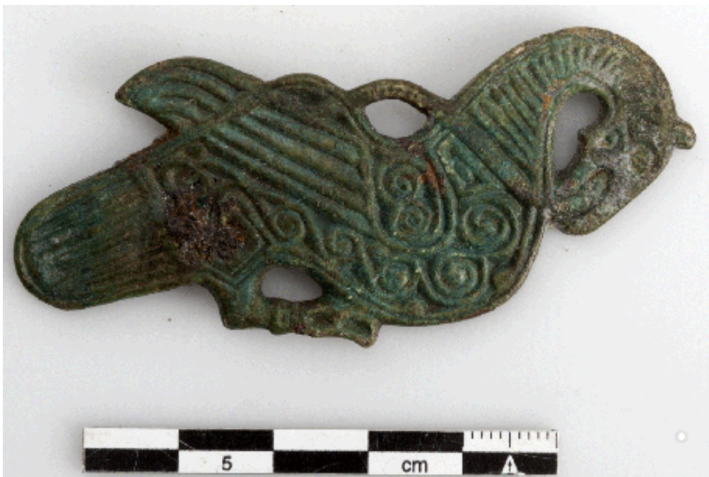
Svaneformet fibula fra Slagslunde.

Begyndelsen af 2019 stod i udstillingsproduktionens tegn. Frem til udstillingsåbningen af vikingeutstillingen Hver dag er en kamp, kom de genstande fra museets samlinger, som skulle udstilles, forbi konserveringen for at blive klargjort og