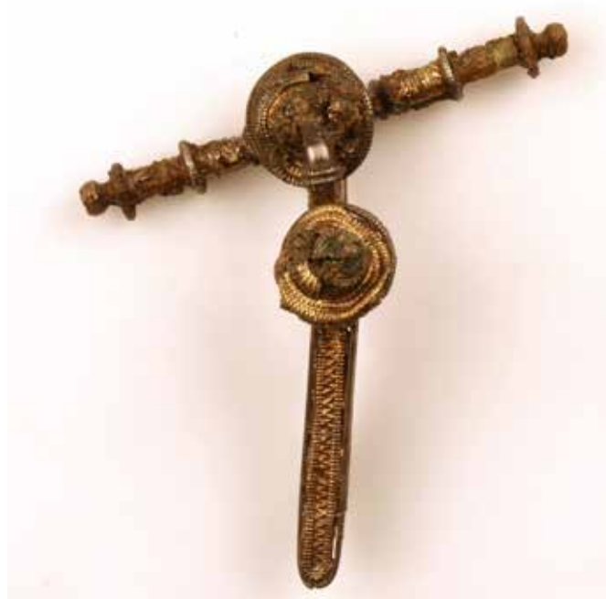
Præparatet fra Kriegers Flak indeholdt foruden en sjælden rosetfibula en kæde bestående af rav-, sølv- og glasperler.