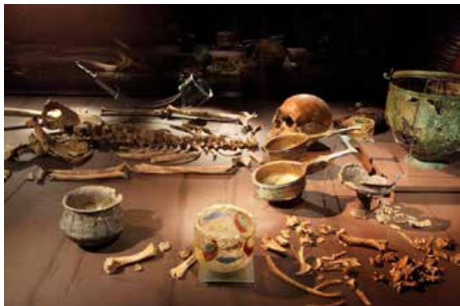
Fyrsten fra Torslunde fra yngre romersk jernalder.