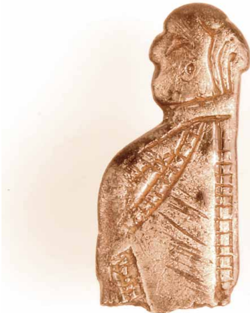
Kvindefigur i sølv, 800-årene. En af årets mange detektorfund.

Af andre fund kan nævnes en sjælden kam-amulet. Amuletten, der stammer fra det baltiske område, er udformet som en miniaturrekam med to dragehoveder, der støder sammen i midten. Amuletten er fra 900-1100 årene.