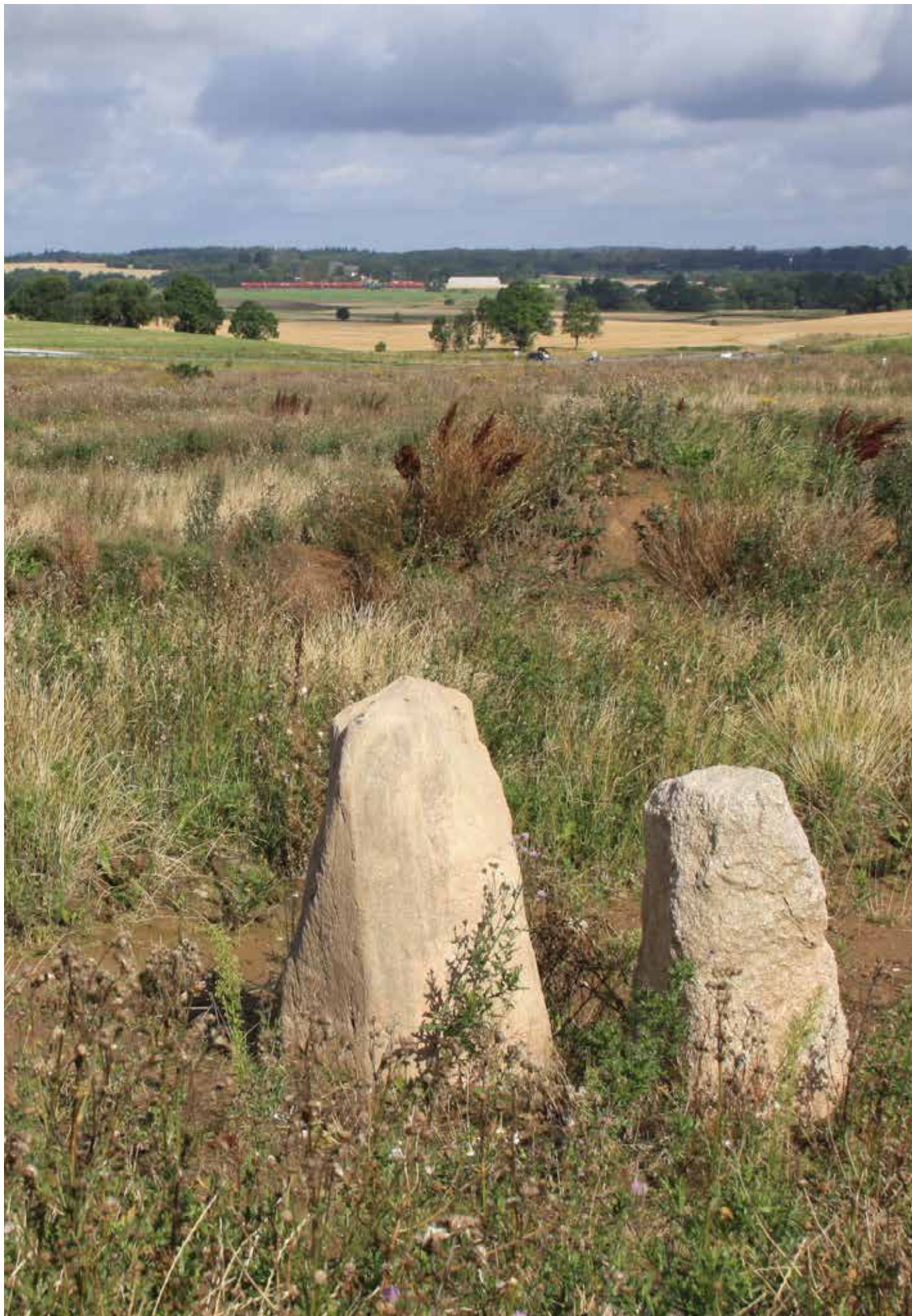
Bautasten ved vikingegravpladsen Rytterkær i Egedal Kommune.