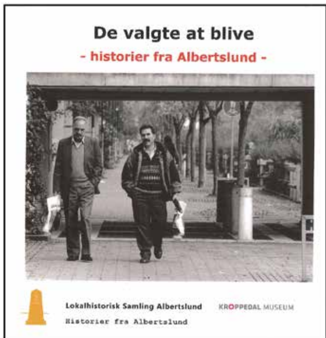
De valgte at blive.

I 2019 er der udkommet tre bøger der er skrevet med udgangspunkt i arbejde fra arkivet. Bogen "De valgte at blive" udkom i 2018, men blev lanceret i februar 2019, da udgivelsen blev forsinket et år. Bogen "Der var engang et forbedringshus" udkom i december 2019, men blev først lanceret i januar 2020. Endelig udkom bogen "Roholmsskolen", der fortæller om skolen i de år den eksisterede inden den ændrede navn til Herstedøster Skole.