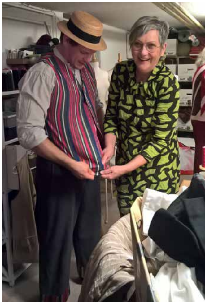
Formidlingsgruppen på kostumejagt på Ishøj Teater.

Arkivet indgår i Bredekærgårds beskrevne visioner, der betoner indvandring til Ishøj og fælles rødder i landbruget i et arbejde med frivillige i at udvikle lokalhistoriske aktiviteter og løfter denne opgave ved formidling, indsamling og registrering. Den aktive indsamling har i stigende grad rettet sig mod forstadens udvikling, i tråd med museets Nyere tids afdelings fokus på tiden efter 1945 og finder daglig støtte i samarbejdet med Thorslunde-Ishøj lokalhistoriske Forening.