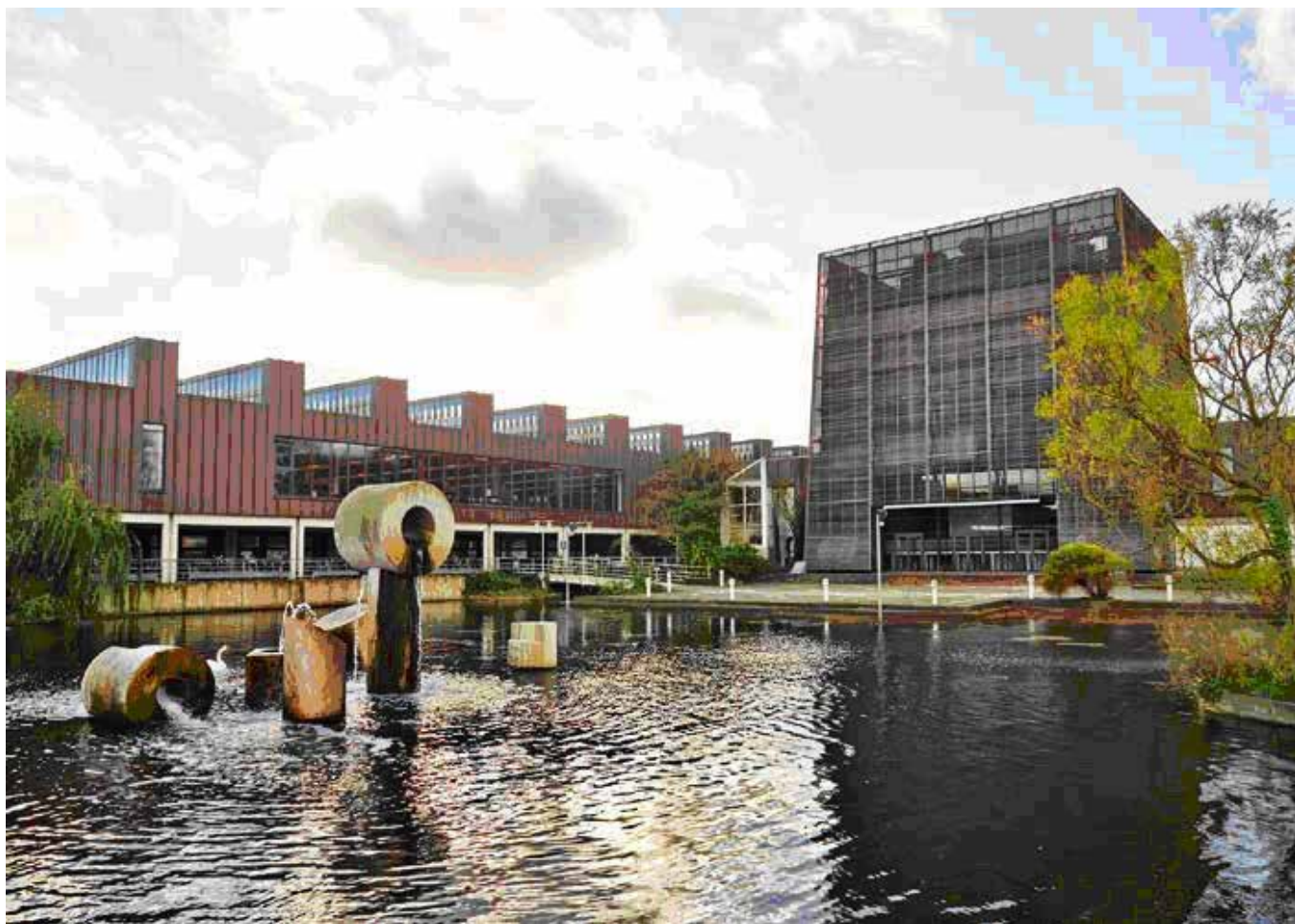
Skolefoto af Albertslund Rådhus.