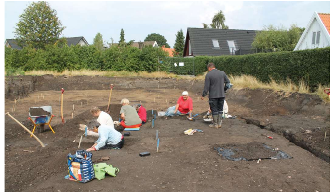
Udgravning af kulturlag anlæg 5.

Det store hus er utvivlsomt hovedbygningen i en gård. 900tallet er præcis den periode, hvor bebyggelsen på Sjælland holder op med at flytte rundt i landskabet, og vi ser de første faste landsbyer. Dette hus, helt oppe ved kirken, er dermed noget af det ældste af det nuværende Ishøj.