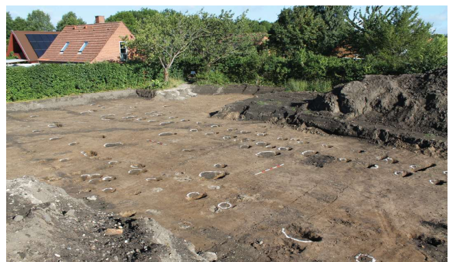
Udgravning af vikingetidshuset