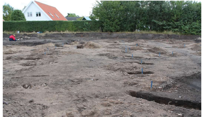
Udgravning af det store middelalderhus, hus 2

Til gengæld savner vi endnu oldtidens gravpladser i Ishøjs landsbys nærområde. Middelalderens døde er gravlagt på kirkegården ved Ishøj kirke, og det er meget troligt, at det område blev taget i brug allerede i vikingetiden, men med al den jernalderbebyggelse, burde der være jernaldergravpladser indenfor få kilometer. De er ikke dukket op endnu.