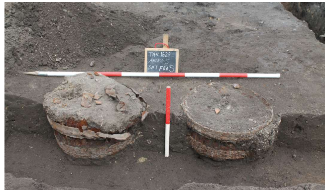
To tænder med læsket kalk i anlæg 5, nyere tid

De forskellige udgravninger støtter det overordnede billede, vi har af samfundsudviklingen fra jernalder til vikingetid og middelalder, fra spredte enkeltgårde, der flytter sig ofte i jernalderen, til begyndende landsbyer i vikingetiden og en fuldt udviklet landsbystruktur med toftegrænser og kirkesogne i middelalderen. Især kirken bidrog til en væsentligt mere stabil struktur i landskabet,