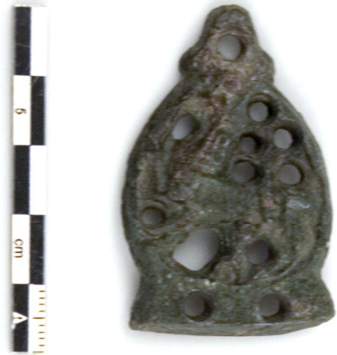
Bogbeslag med gudslam, middelalder.

Vi undersøger stolpehullerne ved at grave en lodret profil gennem dem. Så kan vi se, hvor dybe de er, om bunden er flad eller spids. Det hjælper os med at forstå, hvilke stolper, der hører sammen, og hvordan husene har været bygget. I vikingetidshuset på Kirke-