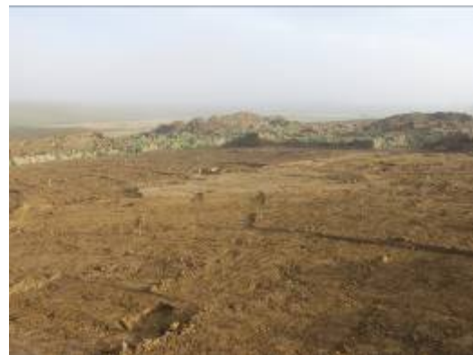
Den arkæologiske undersøgelse er i gang. Pløje-jorden er fjernet og lagt i bunker.

Kroppedal Museum er ansvarlig for undersøgelserne. Originaldokumentation og oldsager opbevares på institutionen.