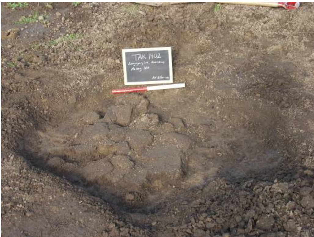
Et meget ødelagt lerkar i toppen af en grube. Målestokken måler 40 cm.

har været opført som en stav- eller bulkonstruktion. På grund af byggematerialerne havde et hus en begrænset levetid. Man regner med omkring 30 år. I Danmark var husene i bondestenalder to-skibede, mens de i bronzealder og jernalder var tre-skibede. De fleste hovedhuse var orienteret øst-vestligt, det kan skyldes ønsket om maksimal solindstråling.