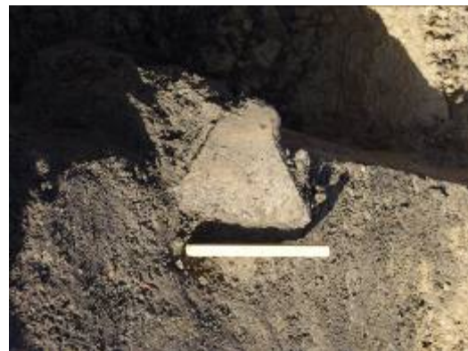
Et stort skår fra et lerkar i en grube.

En grube er en fællesbetegnelse for nedgravninger af forskellige størrelser og til forskellige formål. De kan være mange meter store og flere meter dybe. Den samme grube kan have haft forskellige funktioner. F.eks. kan man have gravet hullet for at skaffe råstoffer i form af ler eller sand, hvorefter hullet er blevet opfyldt med affald fra bopladsen. Det er derfor ofte i gruber man finder mange oldsager.