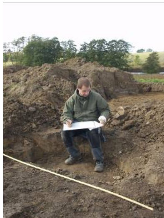
Tegning og beskrivelse af en forhistorisk grube.