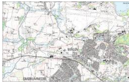
Oversigtskort. En "rude" svarer til 1x1 km.

Muldtykkelsen var generelt ringe, mellem 25 og 35 cm. Mod vest, på skrånningen ved vådområdet var der et tykkere muldlag.