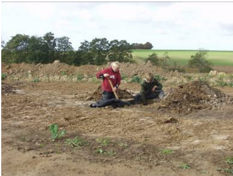
Arkæologerne undersøger en grube. I baggrunden ejendommen Nyholm.

re. Det er på baggrund af denne generelle udvikling i oldtidens samfund, at de vigtige fund fra Knardrup skal betragtes.