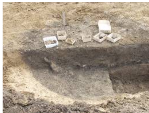
Grube under udgravning. På kanten af gruben står der kasser med keramik.

næppe have ligget der samtidig. Der kan være tale om to faser af den samme gård. Gården har betået af et langhus, og et mindre udhus, og på et tidspunkt blev bygningerne revet ned, og genopført igen lidt derfra. Den første gård blev bygget i ældre romersk jernalder, formentlig i det andet århundrede e. Kr., mens den næste blev opført på overgangen mellem ældre og yngre romersk jernalder, omkring år 200 e. Kr.