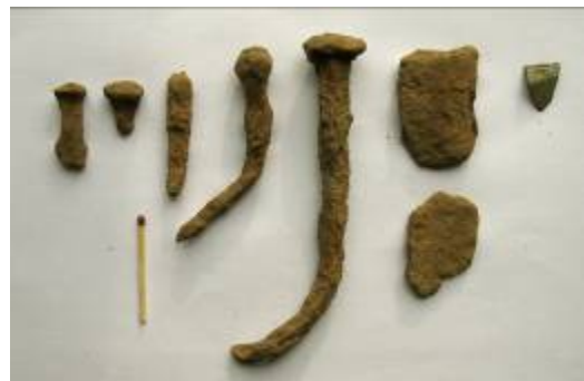
Detektorfund. Flere jerngenstande og et stykke bronzeblik. Datering uvis.

Man begyndte for alvor at dyrke rug og havre ud over hvede, byg og emmer, som var blevet dyrket siden stenalder. Infrastrukturen forbedredes også. Med romersk forbillede anlagde man flere steder stenlagte vejforløb.