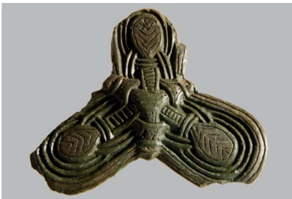
Trefliget spænde. Bronze med sølv- eller tinbelægning.

Københavns Vestegn var i jernalderen en rig oldtidsbygd, men kendskabet til vikingetiden på egnen er begrænset, og udgravningen af gravpladsen kan derfor give væsentlig ny viden om den almindelige bondebefolkning. Det kan f.eks. være viden om de religiøse traditioner og regler i forbindelse med gravlæggelser. Og viden om de forhold, der har eksisteret blandt de levende; blev familier gravlagt nær hinanden, hvem blev der udvist mest omsorg for o.s.v.? Blandt andet derfor ønsker museet, at udgrave resten af den bakkeknold gravpladsen ligger på. Et arbejde der for nærværende planlægges i samråd med lodsejer og Kulturarvsstyrelsen.