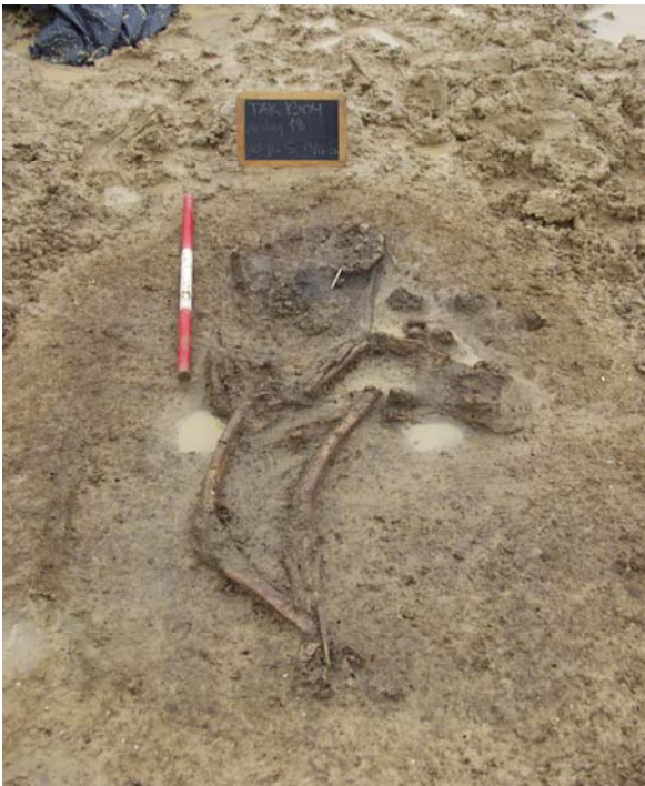
Kvinden med barnet på brystet

gravemaskinen. Sammesteds blev der fundet to glasperler, et stykke sølvtråd og en sammenbukket sølv mønt. I mundhulen på kvinden lå der ligeledes et stykke sølvtråd og en sammenbukket mønt. Sølvet har formentlig været betaling for rejsen til dødsriget.