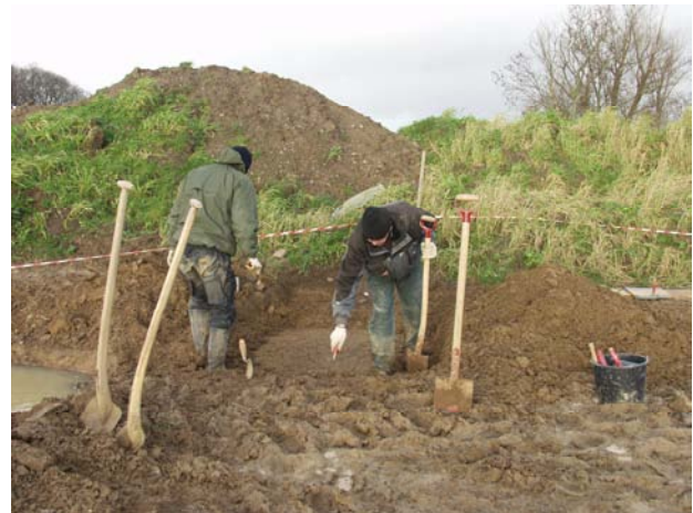
Arkæologerne på arbejde

Udgravningsmetoden blev valgt med baggrund i overvejelser vedrørende de bedste og mest optimale strategier for udgravning i forhold til de omstændigheder, der var til stede. Der blev derfor løbende foretaget en afvejning af tidsforbrug i de enkelte udgravningsmetoder. Der måtte også kontinuerligt tages hensyn til vejrforholdene og den meget vandlidende flade, der skabte problemer med vand og mudder.