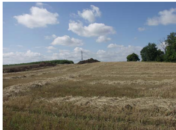
Bakkeknolden med gravpladsen