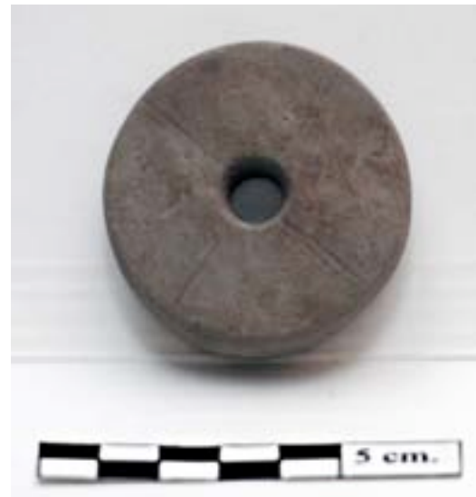
Fig. 3 Tenvægt af sandsten.

Et af de mere kuriøse fund på pladsen, var et kar, hvorved der lå en tenvægt af sandsten. Tenvægten er rund, og flad på begge sider. På den ene side er der ridset et stort kryds, som vi endnu ikke kender betydningen af, eller har nogle paralleller til. Karret selv indeholdt brændte knogler af endnu ukendt karakter.