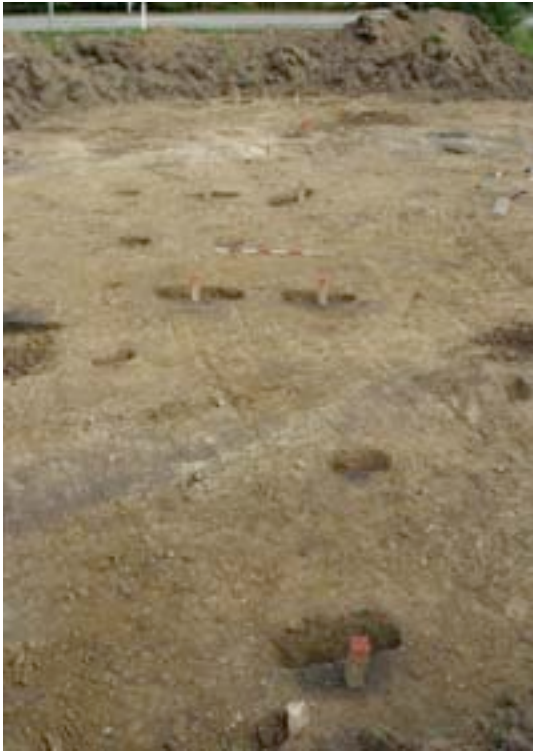
Fig. 2. Hus 1 set fra vest. De rødmaledede klodser markerer de tagbærende stolpehuller.

Hus 2, er nord-syd orienteret, og virker ikke umiddelbart hverken så kraftig bygget eller så langt som de to andre huse. Den mindre længde kunne skyldes at dens nordlige forløb bliver forstyrret af en mulig brønd. Husets umiddelbare mindre udseende i forhold til de to andre huse, samt det at det vender nord-syd gør, at der formentlig er tale om en økonomibygning. Hus 3 bliver muligvis afbrudt af udgravningsgrænsen, men de to østligste stolpehuller, kunne også ses som gavlstolper, eftersom de ikke adskiller sig væsentligt fra de øvrige tagbærende stolper i hus 3. En anden funktion kunne være, at de har fungeret som støttestolper i et længere hus. Der kan ikke umiddelbart siges noget om husenes indbyrdes forhold. Der fremkom forskellige former for gruber på området. Der var affaldsgruber, hvor der blev udgravet både dyretænder, ubrændte og brændte knogler fra tamdyr, samt keramik. I