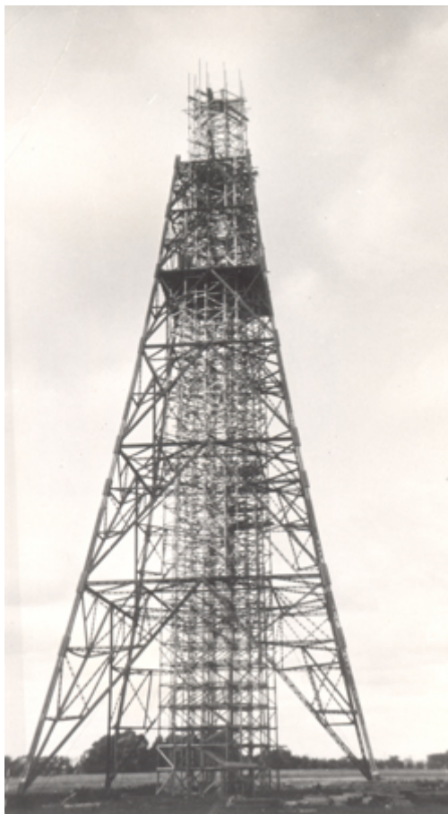
Herstedvester-senderen under opførelse (uden år)

Sendehallen står der endnu, og det samme gælder de boliger, der var blevet opført rundt om stationen til de mange ansatte. Det hele er opført i den for opførelsestidspunktet karakteristiske funkisstil.