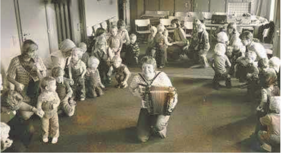
Musikalsk Legestue var et hit

afslutte 1. del i december 1945 – januar 1946. Han bed tænderne sammen, som han selv udtrykker det. Lettelsen over at være i live kom efter endt eksamen!