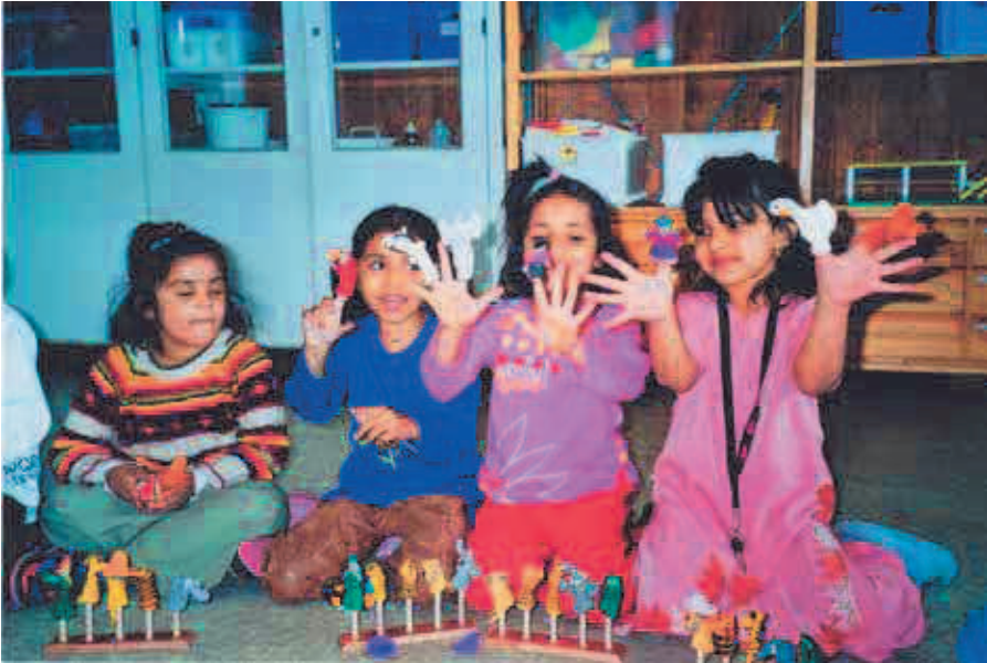
Billedet er fra Birkelundskolen 2005, et indskolingsforløb med tosprogede førskolebørn.

spillede selv meget lidt, så hun er autodidakt.