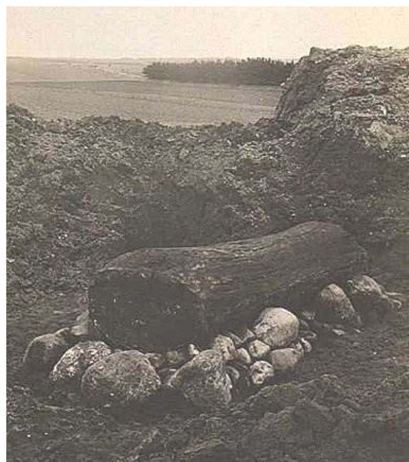
Figur 3 Egtvedpigens grav

ældre bronzealder, bidrager til forståelsen af det rituelle landskab som en kontinuerlig faktor gennem oldtiden. Således, at stedet ikke kun var begravelsesplads i den relativt korte periode, hvor der bygges jættestuer, men også i tider herefter.