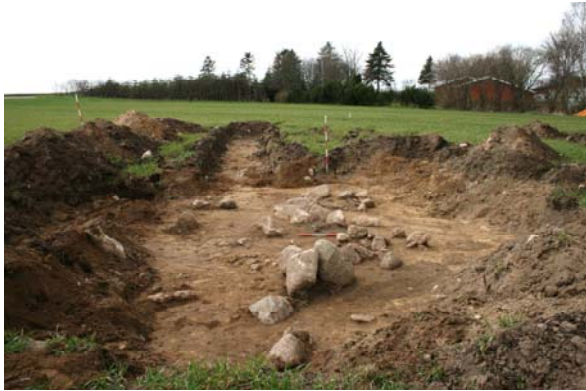
Figur 2 De to stenkonzentrationer

afrensningen fandtes 14 flintafslag, et stykke brændt ler og et enkelt keramikskår, der ikke kan dateres nærmere end til oldtid.